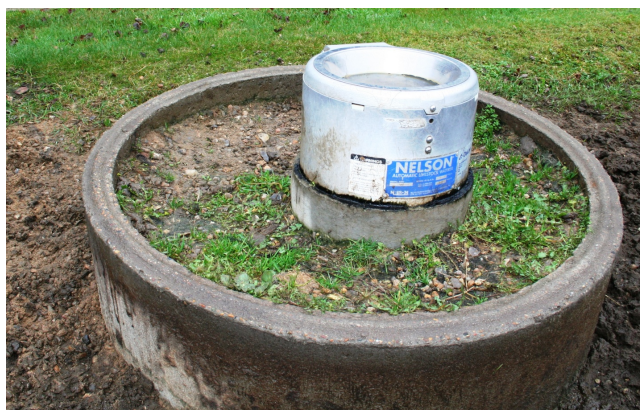
1 m betonring sikrer, at dyrene ikke ødelægger drikkeskålen. Den ekstra kant kan kalvene bruge for at nå op til vandet.

Vandledningerne er placeret i frostfri dybde på minimum 1,20 meter. Røret, som drikkestedet er placeret i, er isoleret udvendig. For at hindre at dyrene ødelægger drikkeskålen, er der placeret en beton ring på 1 meter i diameter udenom. Omkring det lodret gående vandrør op til drikkeskålen er omviklet et varmekabel. Varmekablet er tilsluttet en transformer på 12 volt, der yder 200 W. Temperatur er indstillet til 5 grader.